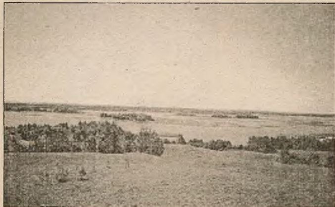
Від на возера Стустра і Снуды з гары Маяк

Экспазіцыя Глыбоцкага гісторыка-этнаграфічнага музея таксама дапаўняецца экспазіцыяй мясцовага дома рамёстваў. І калі Браслаўшчына вядомая ў большай ступені пляценнем з саломкі, пісанкамі, разьбой па дрэве, то візітная картка Глыбокага — кавальскія вырабы. Гледзячы на іх, цяжка падумаць, што звычайнае жалеза можа прымаць такія фантастычныя лёгкія формы. Пабачыць жа ўсю гэтую прыгажосць можна не толькі ў музеі і доме рамёстваў, але і непасрэдна на вуліцах горада. І што прыемна — браслаўскія, і глыбоцкія майстры перадаюць свае тэхнікі дзецям — сваім пераемнікам, што дазваляе не страціць важныя культурныя пласты жыцця народа. На Глыбоччыне наведалі мы і Мосарскі касцёл — выдатны архітэктурны помнік класіцызму 18-га стагоддзя, парк якога разбіты згодна з лепшымі еўрапейскімі традыцыямі.