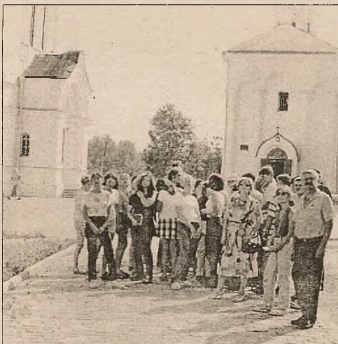
Падчас наведвання Спаса-Еўфрасіннеўскага манастыра ў Полацку

лівым разглядзе заіхаціць, зазьяя новымі, невядомымі раней гранямі. І падарожнічаць па беларускай зямлі — яна змяшчае яшчэ шмат